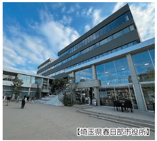
【埼玉県春日部市役所】