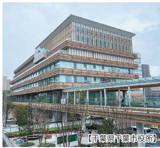
【千葉県千葉市役所】